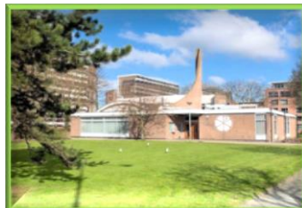
Nieuwe Kerk, Steenvoordelaan 364

Informatie over de Protestantse Gemeente vindt u op: www.pgrijswijk.nl