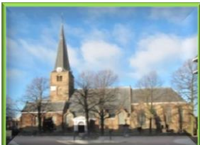
Oude Kerk, Herenstraat 62b

De meeste activiteiten vinden plaats in: